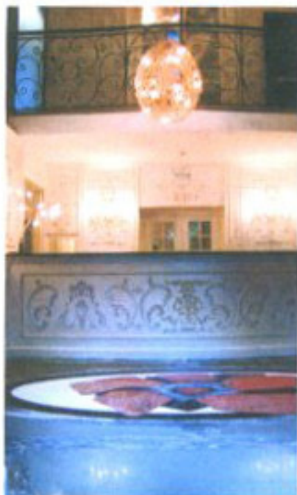
WEEK-END EN VILLE